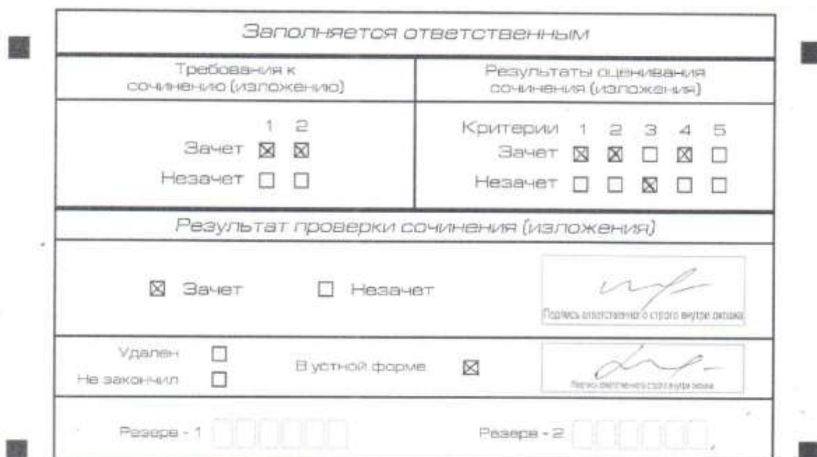
Рис. 9. Область для оценки работы сочинения (изложения) в устной форме

После окончания заполнения бланка регистрации ответственное лицо ставит свою подпись в специально отведенном для этого поле.