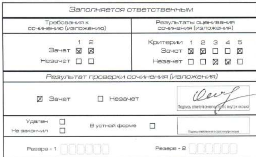
Рис. 2. Область для оценки работы