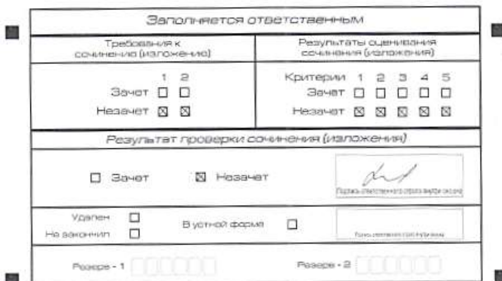
Рис. 7. Область для оценки работы

Если в копии бланка регистрации стоит «незачет» за невыполнение требования № 2, то в клетки по всем критериям оценивания выставляется «незачет». В поле «Результат проверки сочинения (изложения)» ставится «незачет».