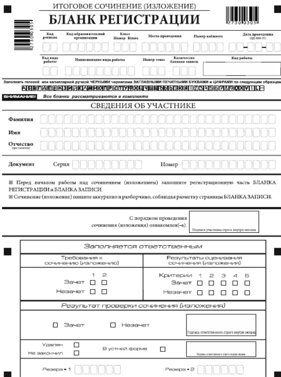
Рис. 1. Бланк регистрации

Бланк регистрации (рис. 1) состоит из трех частей: верхней, средней и нижней.